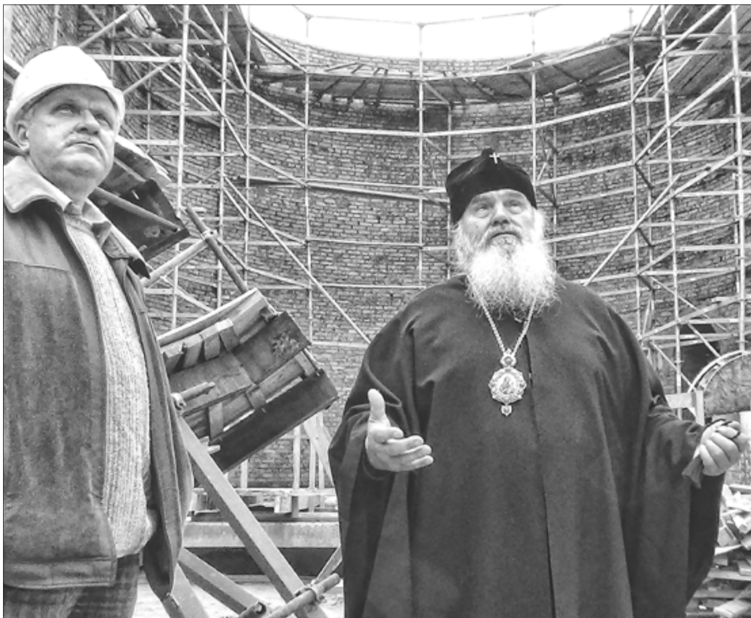
Митрополит Вениамин на строительной площадке Преображенского кафедрального собора