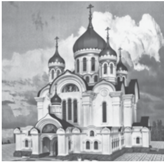
Эскизный проект Преображенского кафедрального собора

Сегодня на необходимость открытия новых приходов указывают высшие церковные инстанции — Архиерейские Соборы Русской Православной Церкви. Во Владивостокской епархии все эти двадцать лет воссоздание дореволю-