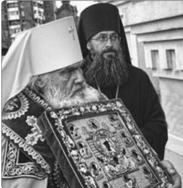
У входа в кафедральный Покровский собор

Подробности на сайте http://vladivostok-eparhia.ru/