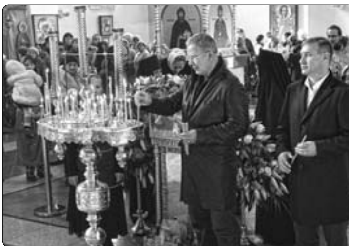
Во время проведения олимпийской эстафеты святой образ посетил легендарный хоккеист В. Фетисов