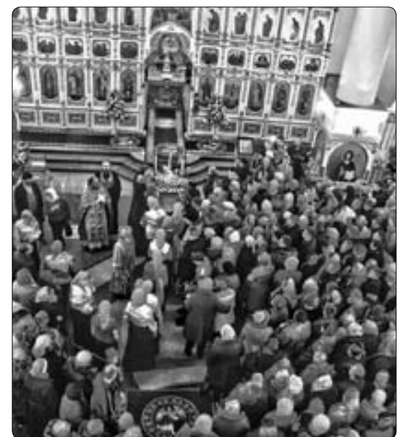
Целый день к Курской-Коренной иконе шел народ