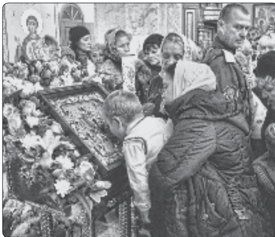
Прихожане Находки у чудотворного образа