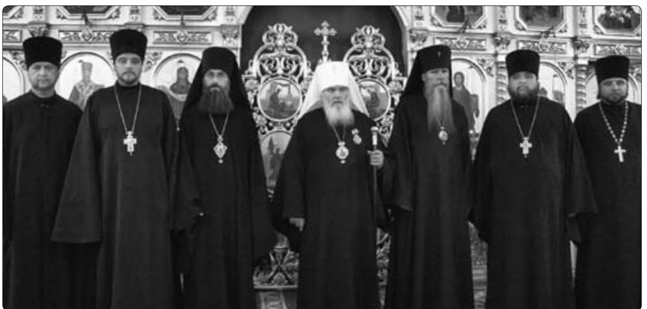
Делегация РПЦЗ с архиереями Владивостокской епархии