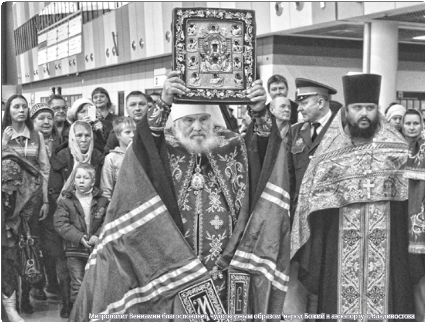
Митрополит Вениамин благословляет, чудотворным образом, народ Божий в аэропорту г. Владивостока

13 ноября 2013 года в Приморскую митрополию прибыла с визитом делегация Русской Православной Церкви Заграницей. Возглавил группу архиепископ Сан-Францисский и Западно-Американский Кирилл (Дмитриев), секретарь Архиерейского Синода Русской Зарубежной Церкви, второй заместитель председателя Синода.