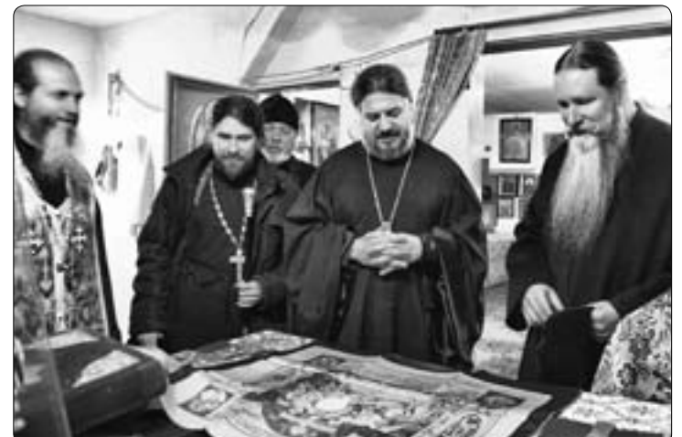
Визит делегации РПЦЗ в с. Хмыловку, где обосновались потомки эмигрантов