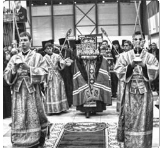
Встреча иконы в аэропорту