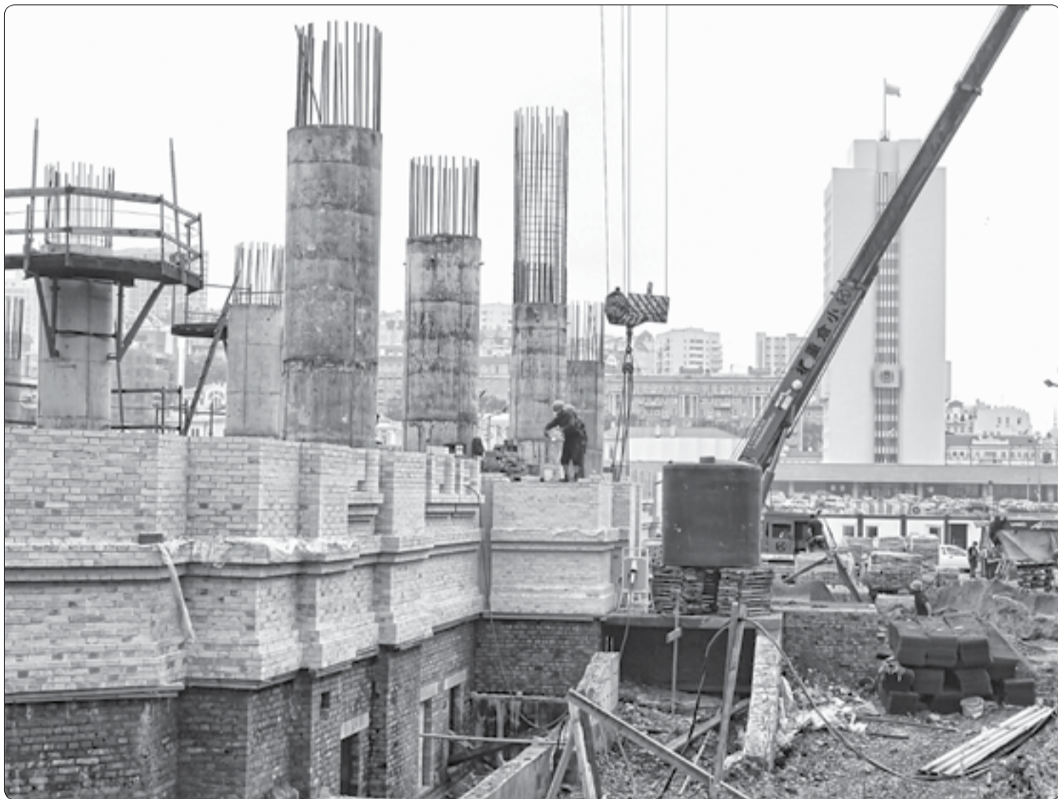
На строительной площадке в районе центральной площади идут работы по возведению Спасо-Преображенского кафедрального собора г. Владивостока

Продолжается возведение кафедрального собора рядом с центральной площадью Владивостока. Десять из одиннадцати колоколов для собора уже находятся на территории епархии, включая большой двухтонный колокол.