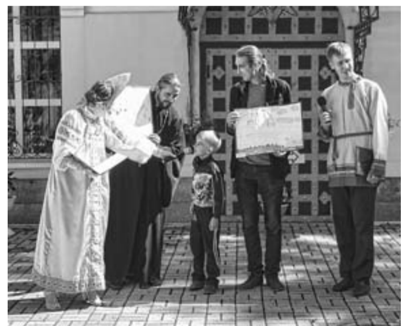
Конкурс детского рисунка в Успенском храме Владивостока

Самым торжественным моментом праздника стало открытие детской площадки. Порядка 40 предпринимателей приняли участие в благотворительной акции, собрав более 100 тыс. рублей. Со словами благодарности обратилась и.о. заместителя главы АГО