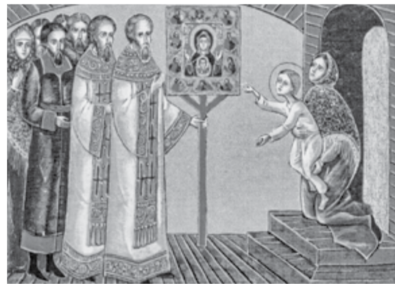
Чудесное исцеление отрока Серафима Саровского

— Матушка, родимая моя, почто ты так горько плачешь? Зачем убиваешься обо мне? Не ты ли меня учила, что Бог не оставляет сирот, и уповающий на Господа не погибнет? Слышал я, родная, как лекарь тебе говорил, помру я. Да ведь