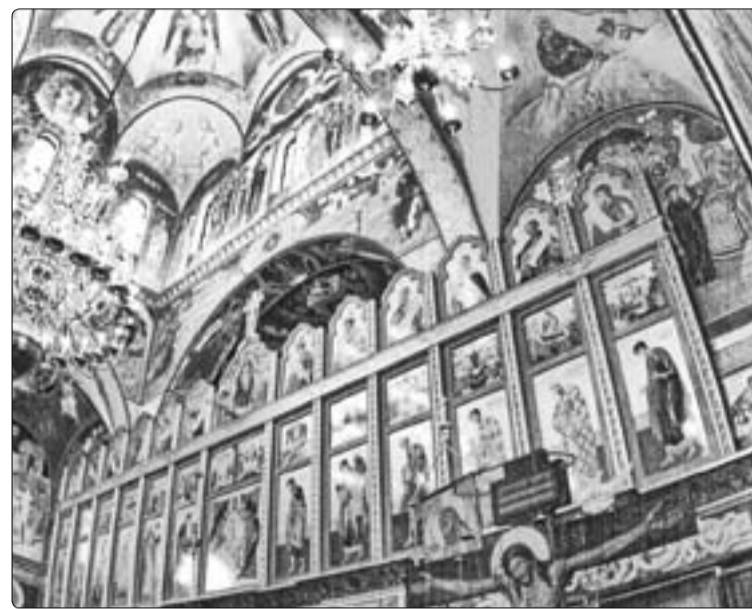
Внутреннее убранство храма св. Иоанна Предтечи в Вашингтоне

— Мы посетили 5 городов, в основном на Северо-востоке США. Вашингтон, Чикаго, Манчестер, Нью-Йорк и один город ближе к западному побережью — это Солт-Лейк-