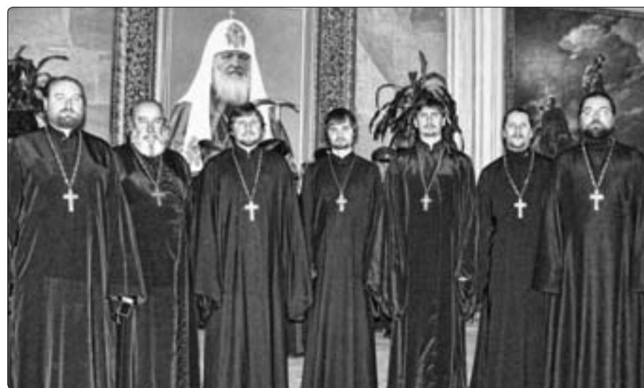
Делегация священников Приморской митрополии на съезде казачьих духовников

Но, возлагая на себя функцию своего рода помощника во многих делах Церкви, казачество действи-