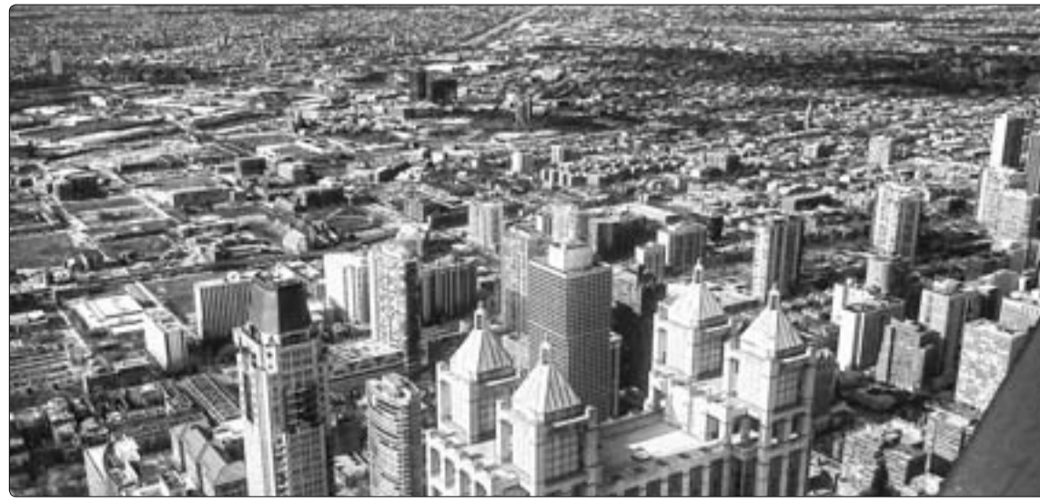
Сейчас в Чикаго. Здесь холодно. Вчера было -8. Из-за небоскребов солнечный свет почти не проникает на улицы, поэтому ещё холодней. Была на последнем этаже самого высокого здания — впечатляет. Небоскребы только в небольшой части города — в центре, а весь остальной город на десятки километров усыпан маленькими домиками, которые почти вплотную стоят друг к другу. — выдержки из e-mail.

— Поскольку, как вы уже отметили, Америка — страна многоконфессиональная, то каждый верит по-своему. Из разговоров с рядовыми протестантами я узнала, что верования конкретного прихожанина на их приходах могут сильно отличаться от ос-