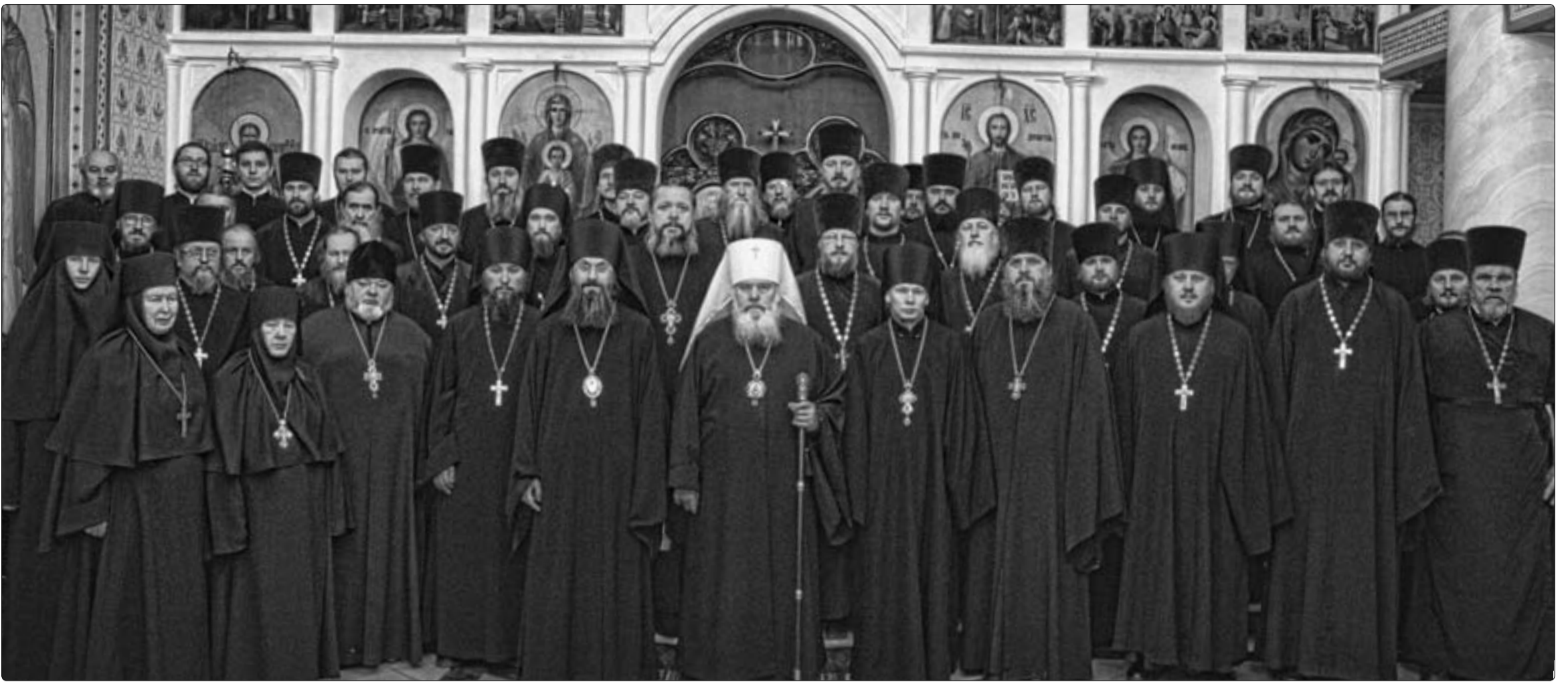
Духовенство Владивостокской епархии в храме Казанской иконы Божией Матери г. Владивостока на годовом собрании

Отчетное епархиальное собрание обозначило проблемы и отметило успехи в епархиальной жизни