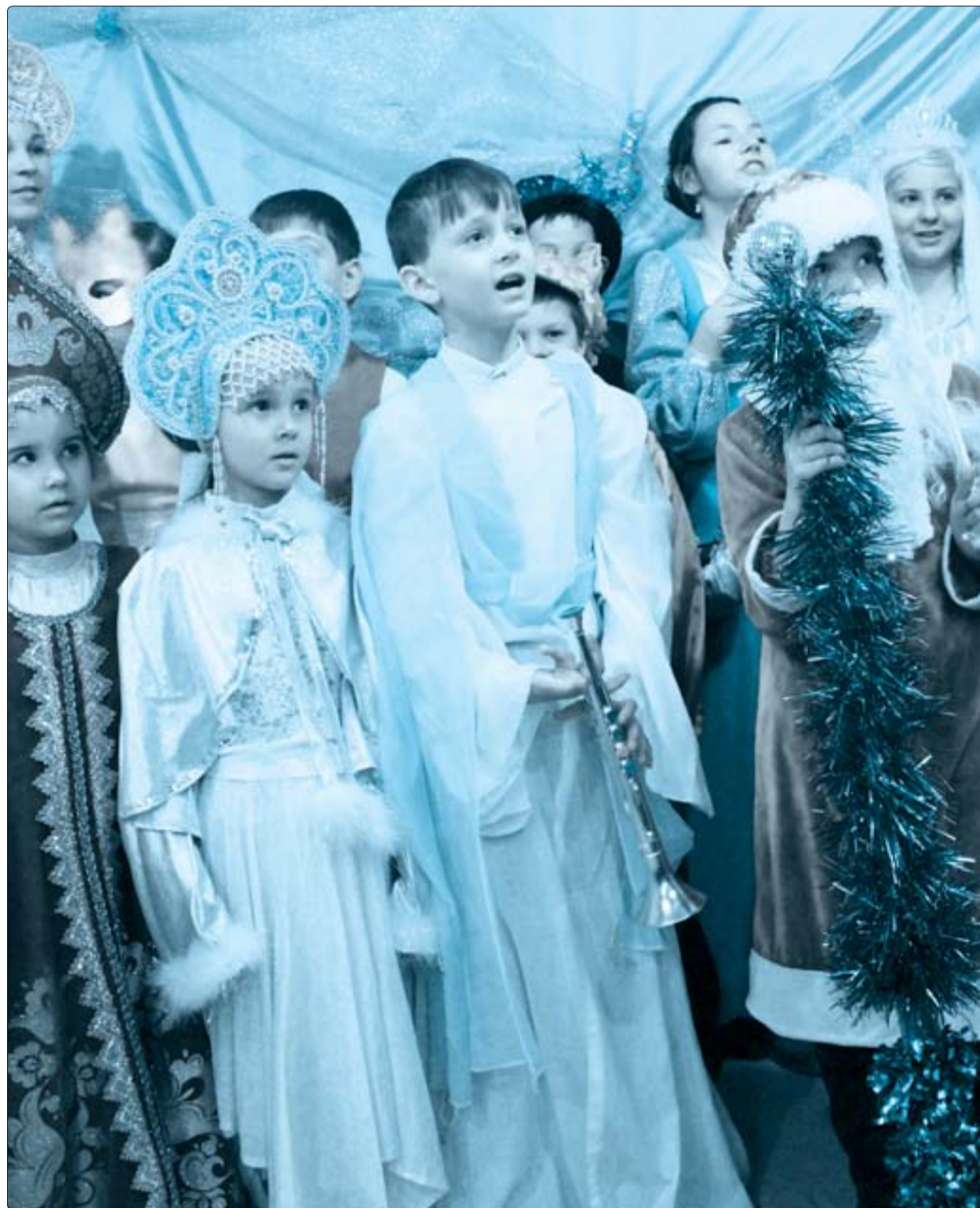
Воспитанники епархиальной воскресной школы на праздничном рождественском утреннике