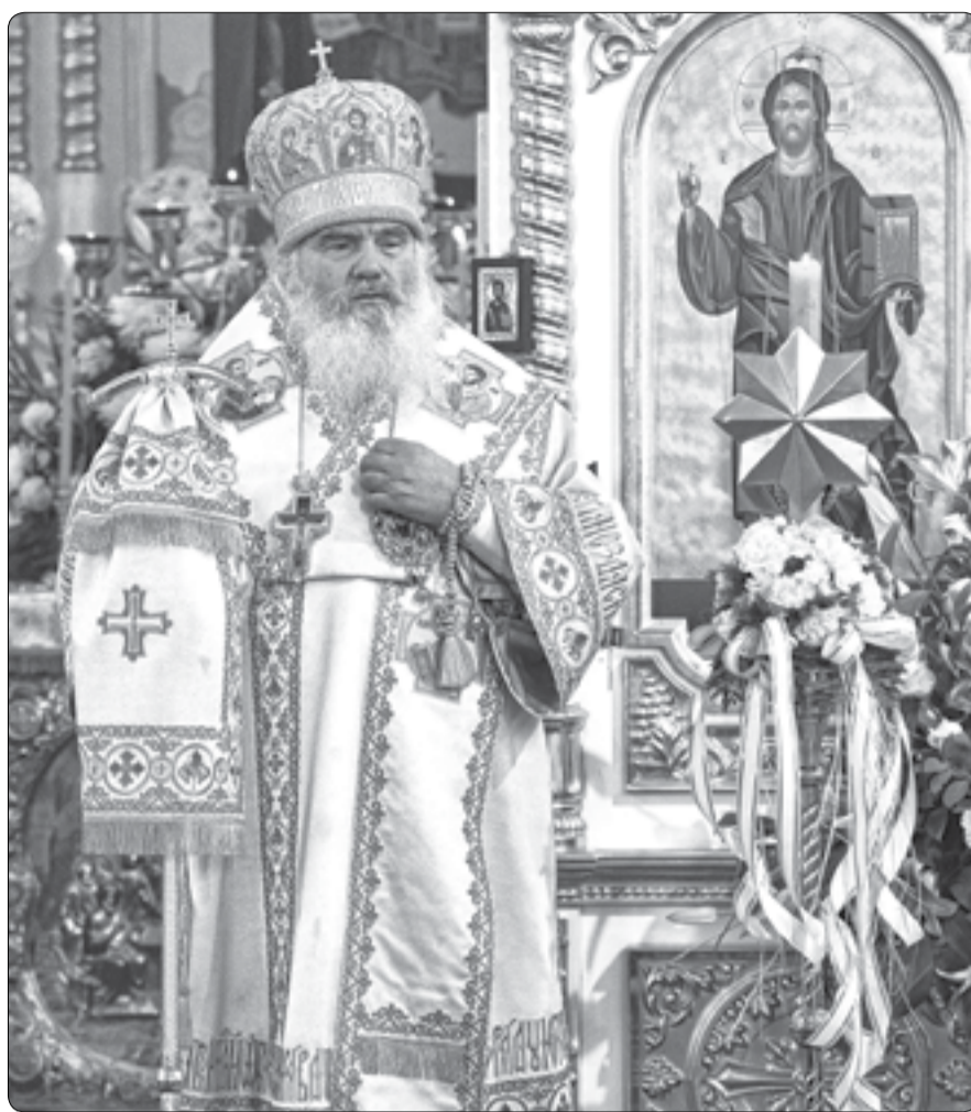
Христос рождается – славьте, Христос с Небес – встречайте!

Поспешим же, братья и сестры, в духовный Вифлеем, Христос ждёт нашей ответной к Нему любви. Откроём навстречу Богу Любви наше чистое и любящее сердце. Родившийся две тысячи лет назад в Вифлеемских яслях Христос и теперь жаждет родиться и жить в сердце каждого из нас. И если мы примем Христа в наше любящее и верующее сердце, тогда не только мы, но и всё наше общество, вся Россия изменится к лучшему, преобра-