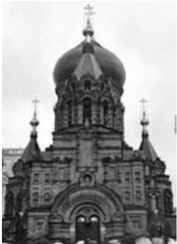
Софийский собор в Харбине

Последние годы обильно насыщены для дальневосточной земли значимыми событиями. Визиты Святейшего Патриарха Кирилла сначала в Японию, а затем и в Приморскую митрополию в сентябре 2012 г. и нынешнее его посещение Китайской Православной Церкви говорят о пристальном внимании Первосвященителя к духовной жизни Азиатско-Тихоокеанского региона. Особое место в этом ряду занимает Харбин со своей богатейшей историей, тесно связанной с судьбами наших соотечественников, вплетенными в общую канву общественного и церковного устройства в этом городе. Напомним, в первой половине XX столетия здесь действовало более 20 церквей и проживали около 100 000 наших соотечественников, находившихся в эмиграции после Гражданской войны.