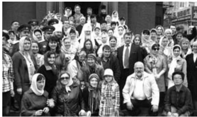
Памятное фото со Святейшим Патриархом у Покровского храма

— Харбин занимает особое место в наших сердцах. Этот город напрямую связан с Россией — своей историей, своей культурой. Именно здесь было наибольшее количество китайских православных людей. Здесь я сегодня совершил Патриаршую Литургию в присутствии верующих из китайского народа. Пусть Господь милостью Своею сохраняет православную общину Харбина и сам этот чудесный город.