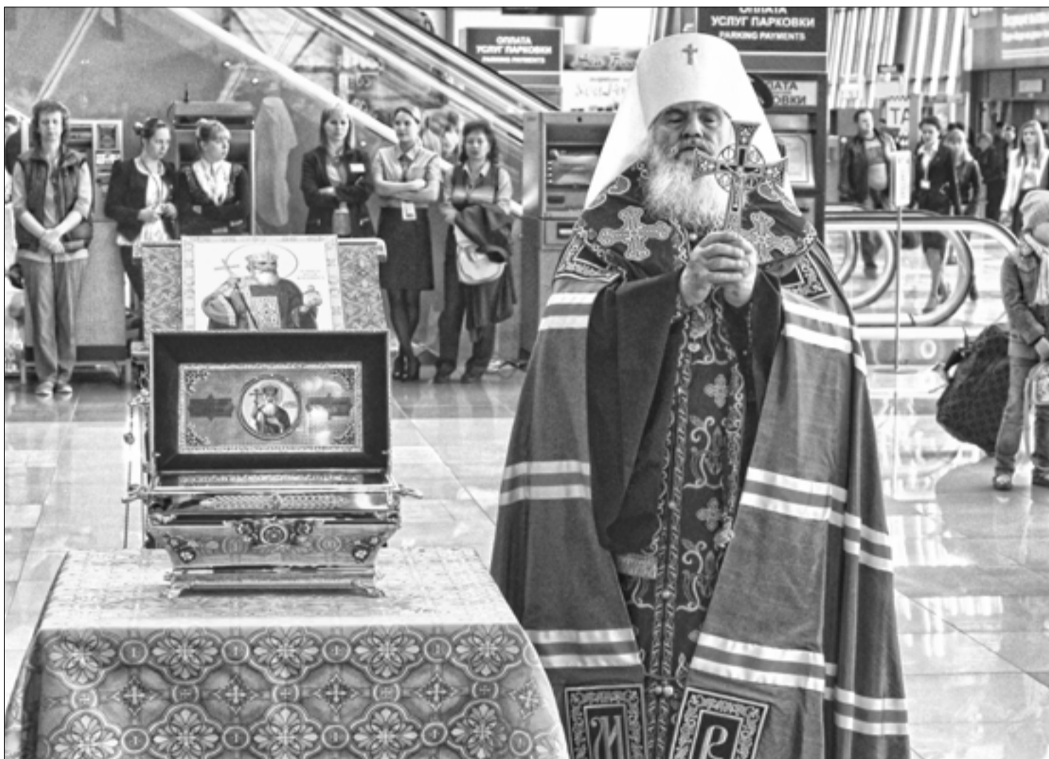
Митрополит Владивостокский и Приморский Вениамин совершает молебен в аэропорту г. Владивостока во время встречи раки с мощами святого равноапостольного князя Владимира

К 1025-летию Крещения Руси из Владивостока начался Всероссийский крестный ход