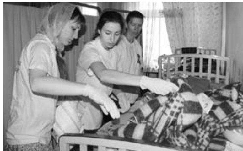
Добровольцы службы «Милосердие» в 1000-кочной больнице