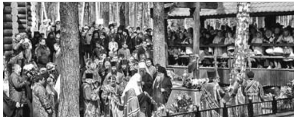
Святейший Патриарх Кирилл в мужском монастыре святых Царственных страстотерпцев