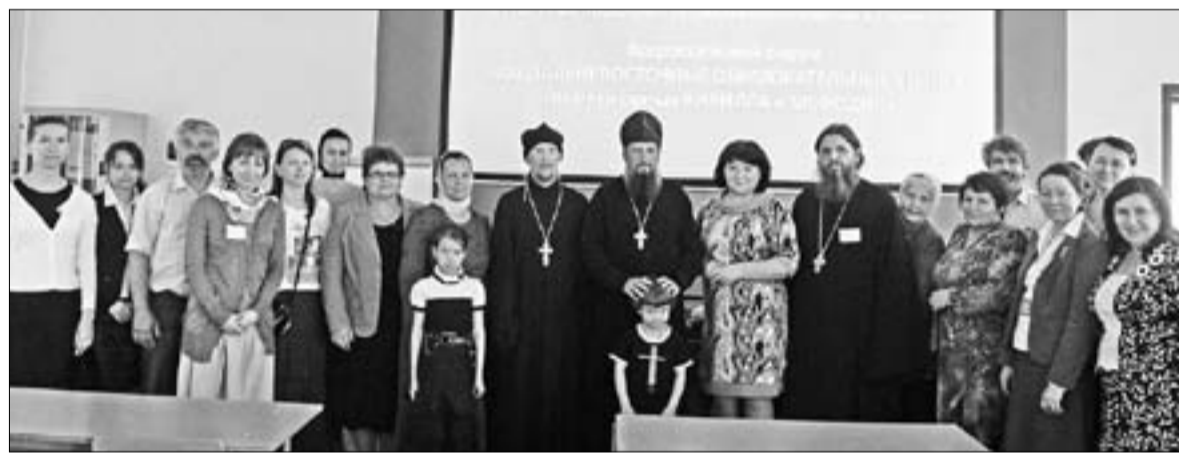
Памятное фото участников конференции

Создать рабочую группу по организации паллиативной (хосписной) помощи населению края. Включить в нее представителей Департамента здравоохранения Приморского края и Владивостокской епархии.